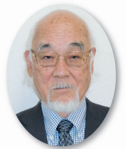
埼玉医療生活協同組合 理事長