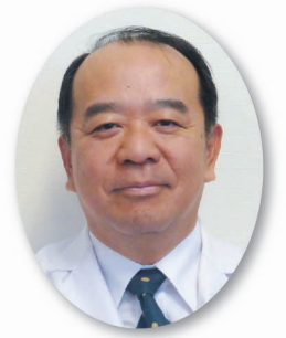
羽生総合病院 院長

埼玉医療生活協同組合のさらなる発展のために、今年度もご協力賜りますようよろしく御願ひ申し上げます。